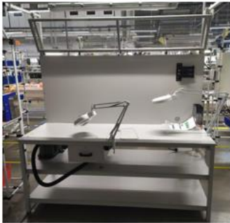
Fig. 1 – An example view of the measurement station